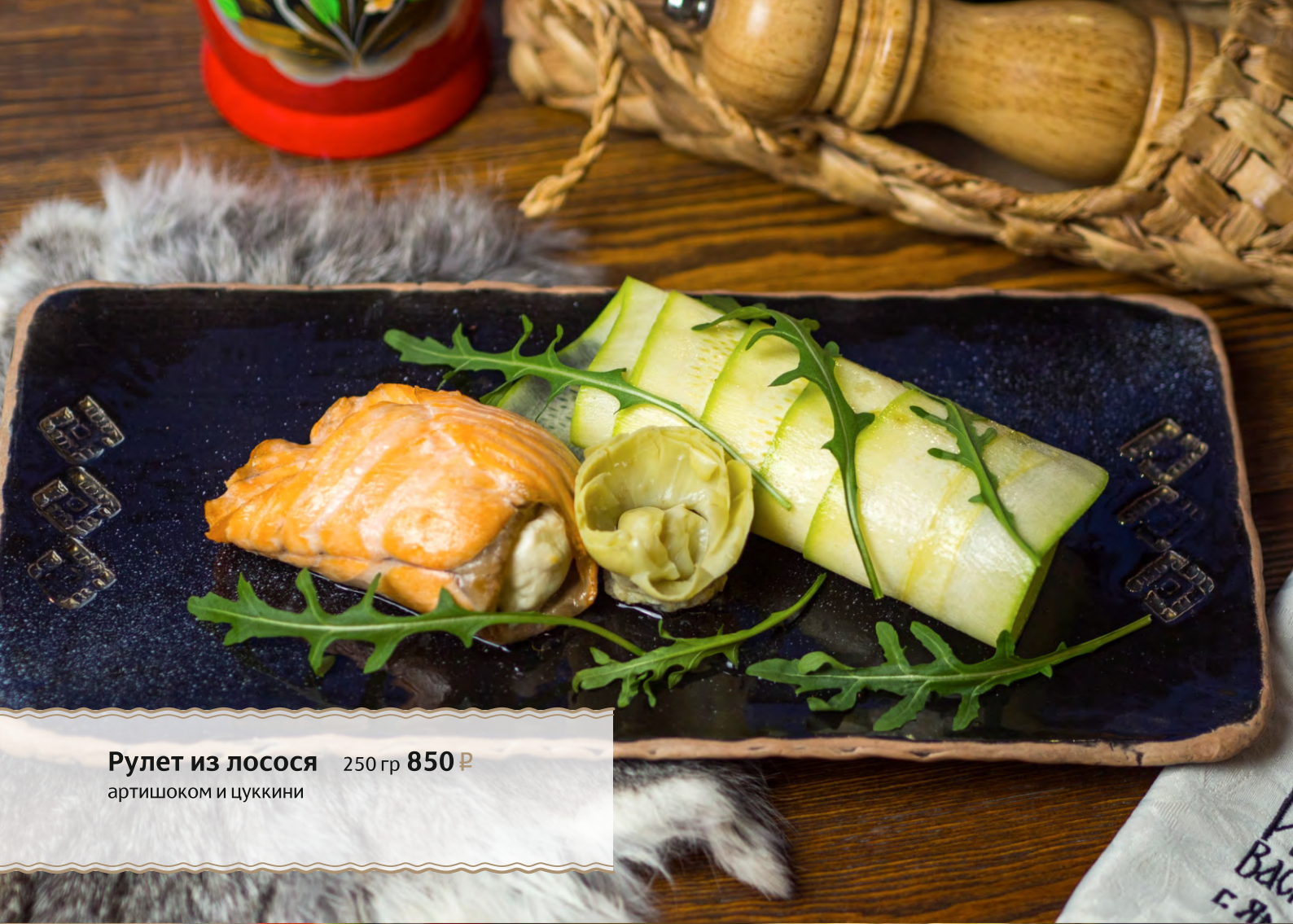
Рулет из лосося 250 гр 850 Р артишоком и цуккини