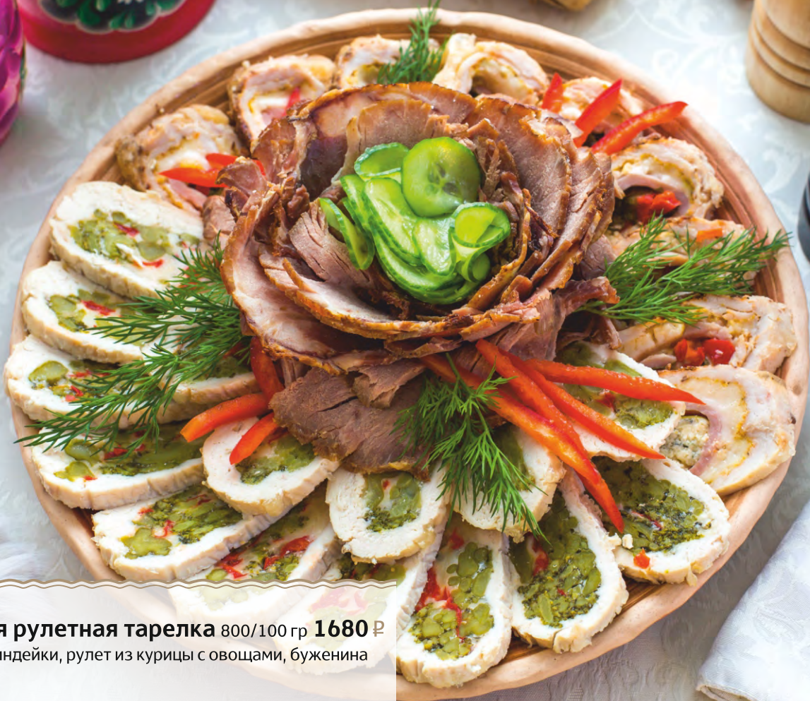
Мясная рулетная тарелка 800/100 гр 1680 Р рулет из индейки, рулет из курицы с овощами, буженина