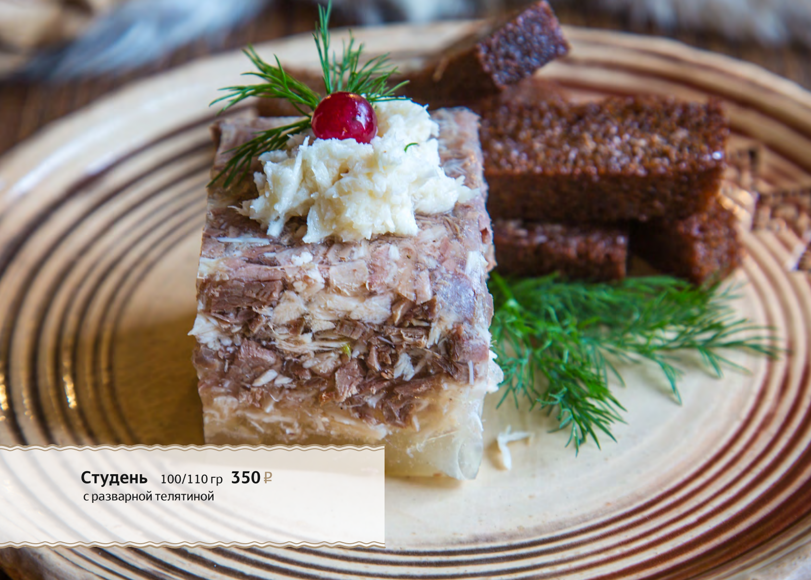
Студень 100/110 гр 350 ₺ с разварной телятиной