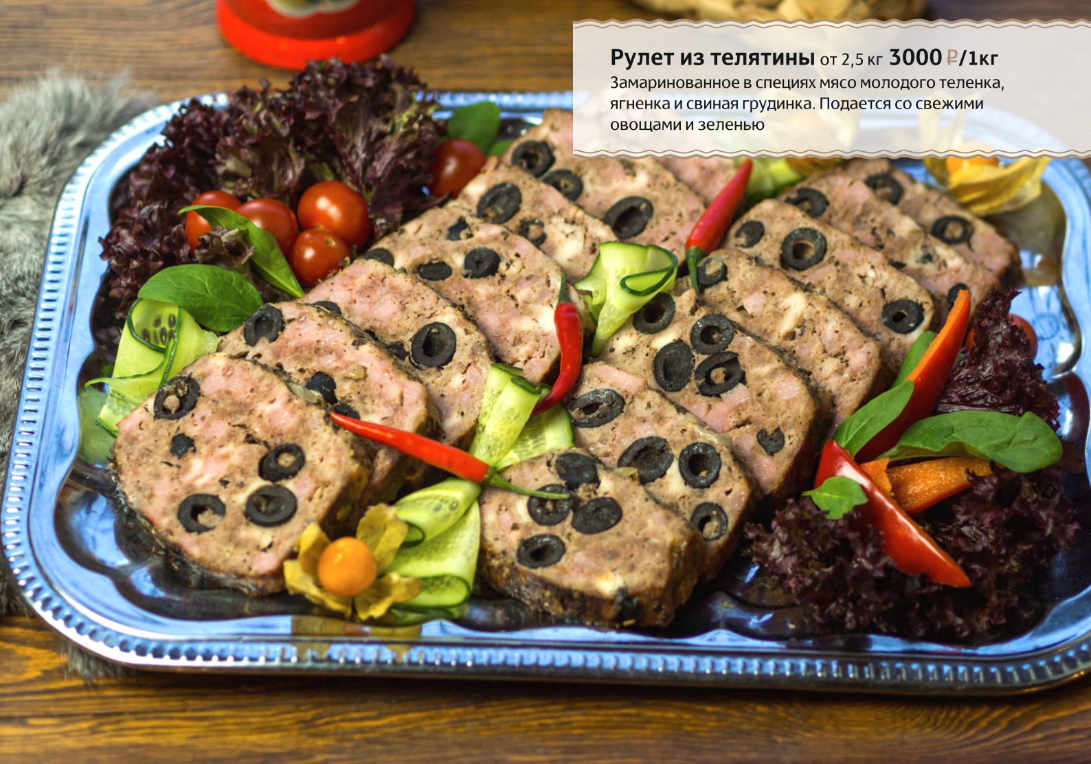
Рулет из телятины от 2,5 кг 3000 Р/1кг Замаринованное в специях мясо молодого теленка, ягненка и свиная грудинка. Подается со свежими овощами и зеленью