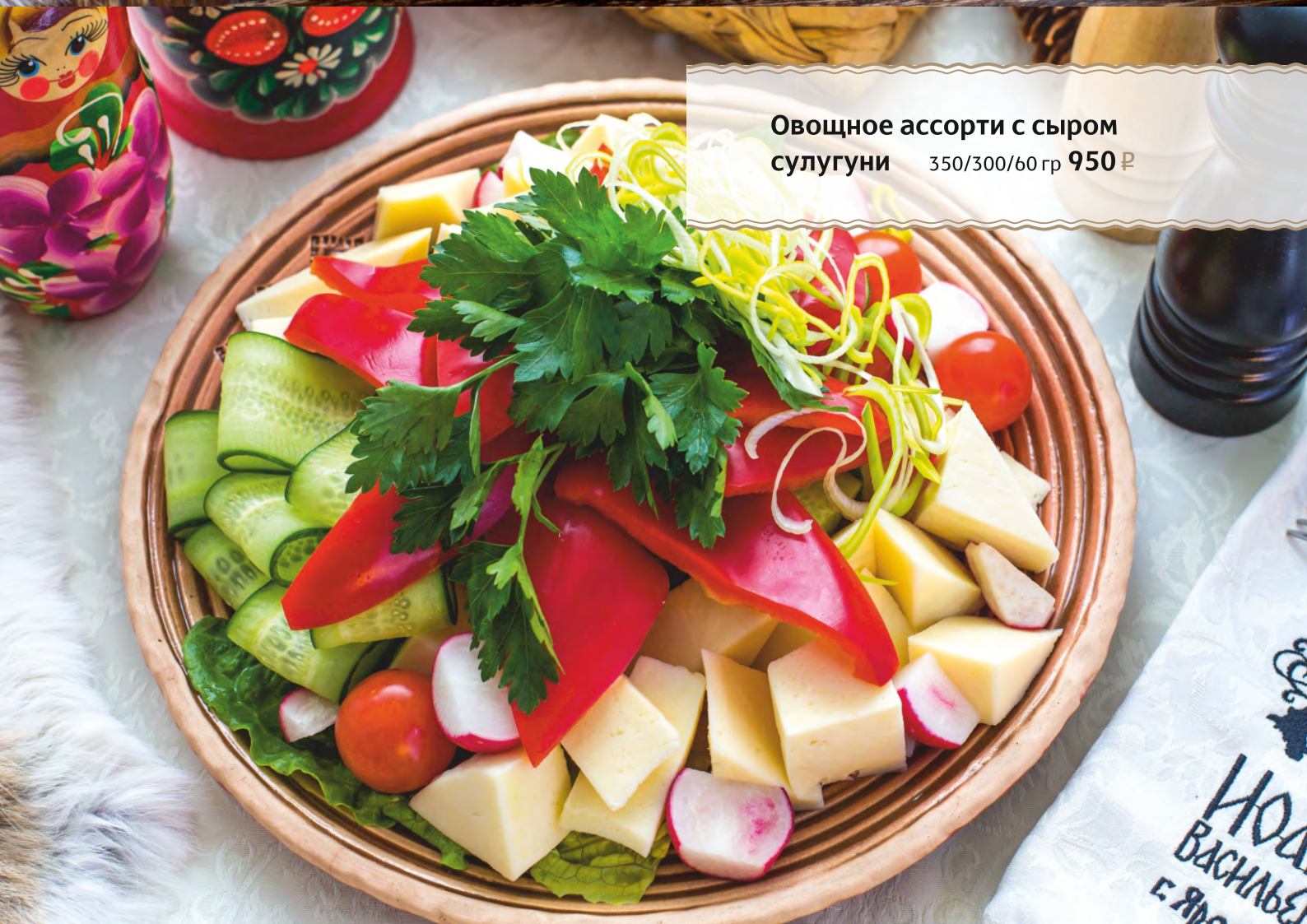
Овощное ассорти с сыром сулугуни 350/300/60 гр 950 ₺