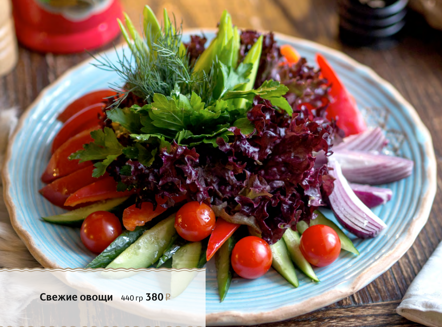
Свежие овощи 440 гр 380 ₺