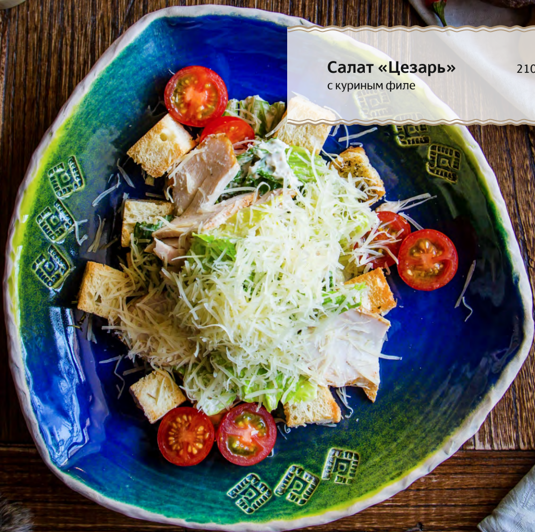
Салат «Цезарь» 210 гр 420 Р с куриным филе