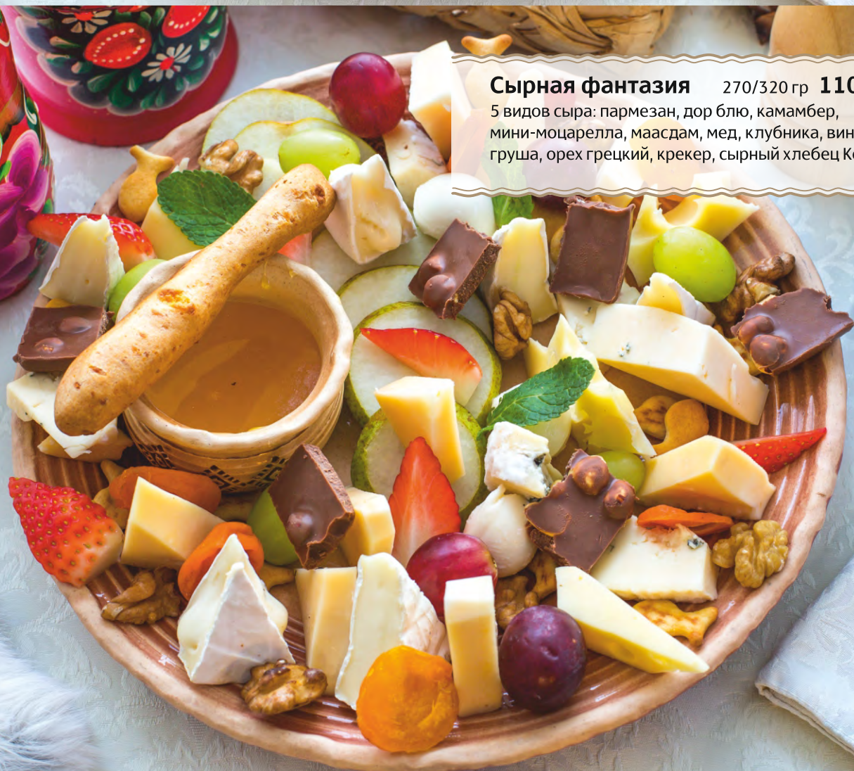
Сырная фантазия 270/320 гр 1100 Р 5 видов сыра: пармезан, дор блю, камамбер, мини-моцарелла, маасдам, мед, клубника, виноград, груша, орех грецкий, крекер, сырный хлебец Кежо