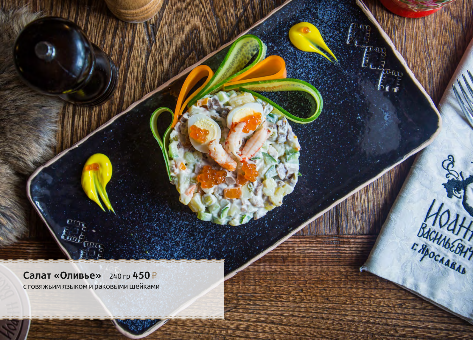
Салат «Оливье» 240 гр 450 Р с говяжьим языком и раковыми шейками