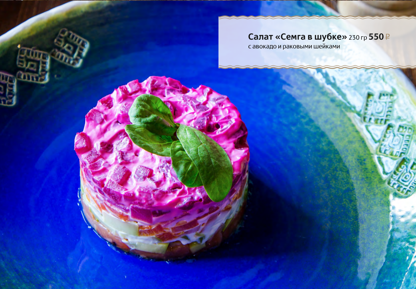
Салат «Семга в шубке» 230 гр 550 Р с авокадо и раковыми шейками