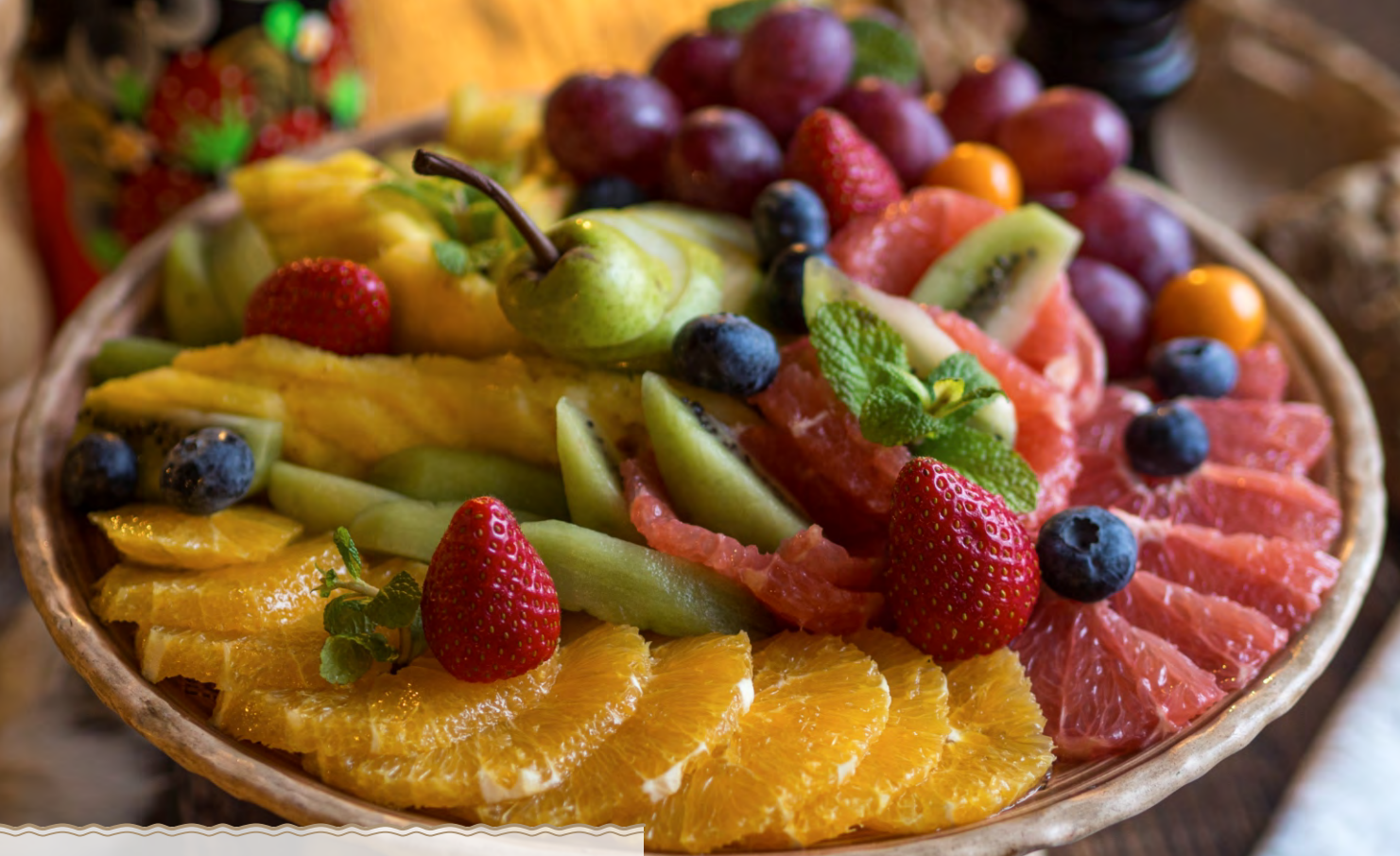
Фруктовая ваза 1000 гр 1200 Р из сезонных фруктов и ягод