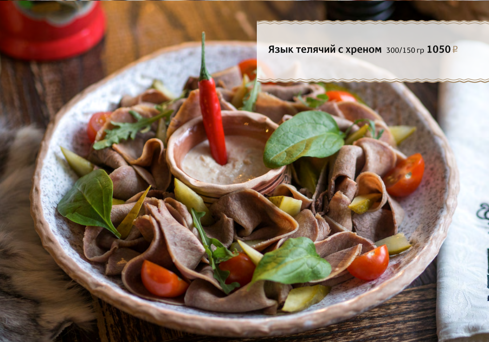
Язык телячий с хреном 300/150 гр 1050 ₺